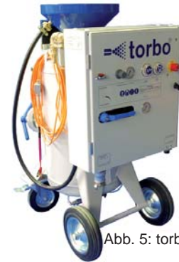
Abb. 5: torbo-Maschine M120

Seit 2007 läuft die Sanierung der Karlsbrücke bei laufendem Besucherstrom. Im ersten Abschnitt wurde das Kopfsteinpflaster und die Schutzgeländer erneuert. Bei der Restaurierung der Sandsteinmauern, mussten einige Stellen ausgetauscht werden. Damit die neuen Steine sich den alten Sandsteinen farblich anpassen, wurden die alten Steine mit heißem Dampf abgewaschen und dann schonend mit dem torbo-System abgestrahlt. Bei dieser Arbeit durfte kein Abrieb erfolgen, sodass das torbo-Gerät M120 so eingestellt wurde, dass der Effekt