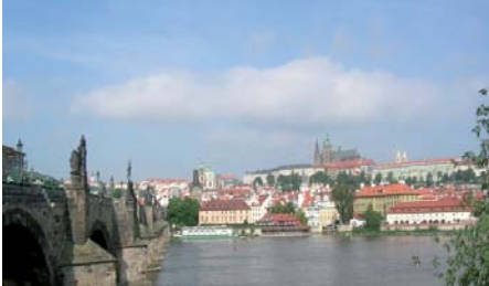
Abb. 2: Karlsbrücke

Die Grundsteinlegung erfolgte im Jahr 1357 durch Kaiser Karl IV., an einem von einem Astrologen ausgerechneten optimalen Datum am 9. Juli um 5:31 Uhr. Vorbild für die Brücke war übrigens die Steinernen Brücke von Regensburg. Die Brücke wurde bis zum Jahr 1870 noch Prager Brücke genannt.