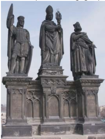
Abb. 3: Heiligenfiguren an der Karlsbrücke

Zahlreiche Heiligenfiguren aus dem 17./18. Jahrhundert säumen die Ränder der Brücke. Als bekannteste Heiligenfigur gilt die Gedenkstätte des Heiligen Nepomuk: Anno 1393 ließ Wenzel V. den Geistlichen in die Moldau werfen. Nepomuk erkrankte und wurde später heilig gesprochen.