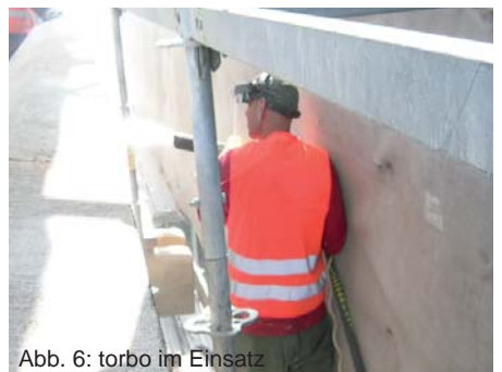
Abb. 6: torbo im Einsatz

mit dem Micro-Sandstrahlen vergleichbar ist und trotzdem das torbo-System ausgenutzt werden konnte. Als Strahlmittel wurde daher feingemahlener Feldspat verwendet. Die Sandsteinarbeiten wurden unter der Leitung und Aufsicht des akademischen Steinbildhauers doc. Jiri Novotny (Leiter der Restaurierungsfakultät der Universität Pardubice) durchgeführt. Die Firma Axiom Real s.r.o. nimmt die Sandstrahlarbeiten in engem Kontakt mit unserem tschechischen Händler Herrn Ladislav Janca vor. Zum Einsatz kam die Laval-Düse Nr. 6 mit dem Wirbelvorsatz TS98. Die Düse war an einem 19/7 Schlauch angeschlossen und der Strahlendruck betrug 3 bar. Mittlerweile sind die Sandstrahlarbeiten abgeschlossen und die Karlsbrücke erstrahlt wieder im neuen alten Glanz.